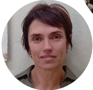
Jacqueline Acres Living University, Afrique du Sud