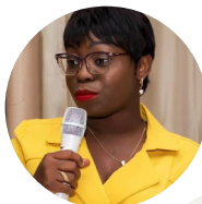
Naomi Tulay-Solanke Community Healthcare Initiative, Liberia