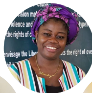
Mmonbeydo Joah Organisation for Women and Children, Liberia